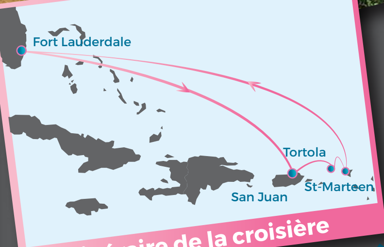
Itinéraire de la croisière

Itinéraire : Fort Lauderdale - en mer - San Juan - Tortola - St-Marteen - en mer - Fort Lauderdale